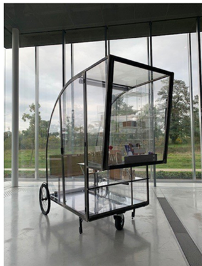
Rolling House, conçue par l'agence Metek (Sarah Bitter avec Christophe Demantké)